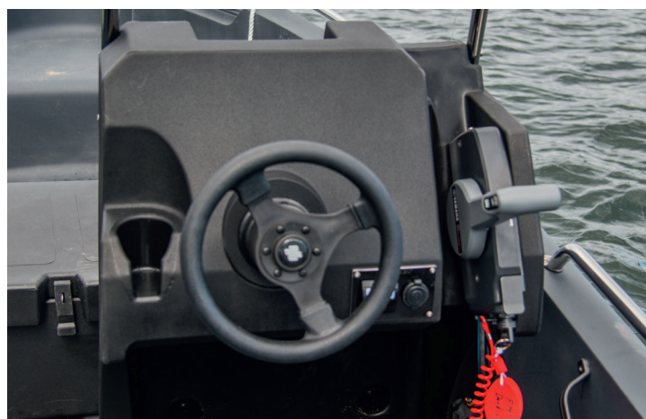
▲ Förarplatsen har mugghållare, plats för navigator och 12-voltsuttag för mobilen, som läggs i facket högst upp.