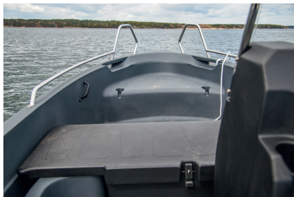
▲ De rundade formerna, den mjuka plasten och lätta stuvfacksluckor minskar risken att klämma eller slå sig ombord. Säkert!

båten i testet. Föraren har ett vadderat ryggstöd som gör Pioneer överlägset skönast att ratta lite längre sträckor. Båten är tryggt nog säkerhetsmärkt av Det Norske Veritas och kan bära fyra personer som ledigt ryms på de tre tofterna. Plastinredningen är mjuk och till skillnad från alubåtarna i testet finns här inga vassa kanter eller hörn att göra sig illa på.