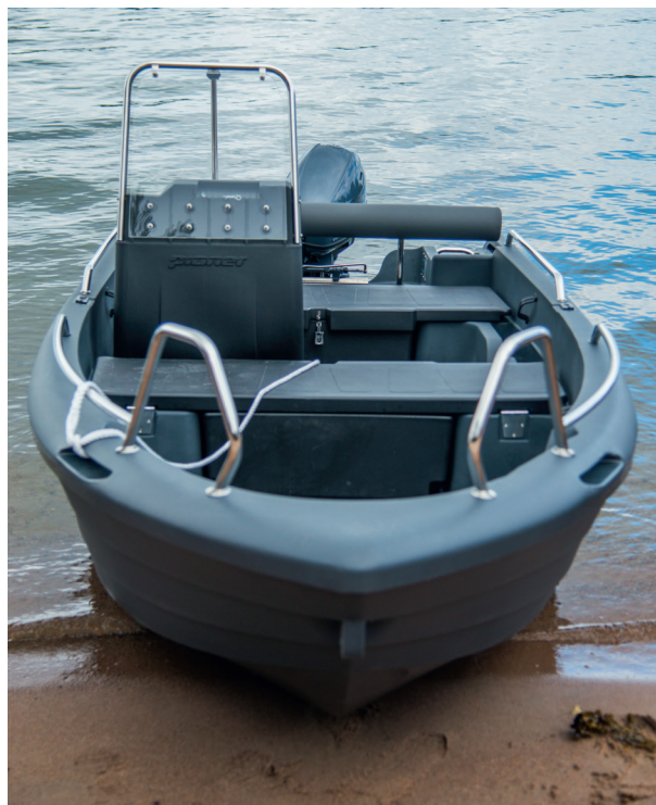
▲ Det rotationsgjutna plastskrovet är tåligt mot stötar och slag. Om en skada ändå uppstår, går det att laga med en värmpistol och en ny plastbit.

Metoden har flera fördelar. Produktionen går snabbt, är billig och båten kan förses med en mängd små detaljer som är ingjutna i skrovet. Pioneer 14 Active är den bekvämaste