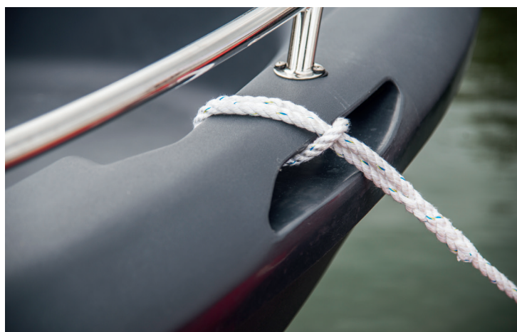
▲ Pioners lite udda lösning funkar, men det är något besvärligare att dra linan genom öppningen istället för att göra fast den runt en vanlig knape.