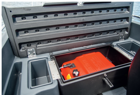
▲ Förvaring finns i mittoften (bilden) där tanken förvaras, och i aktertoften. Tanken kan även förvaras i aktertoften.

Vid en snabb titt ser den norska plastbåten betydligt mer påkostad ut än både Linder och Buster. Som utflyktsbåt är den bäst i test tack vare många sittplatser och DNV-godkännandet för fyra personer. Ändå kostar den rotationsgjutna Pioneer 14 Active strax under 100 000 kronor med F25, alltså 20 000-30 000 kronor mindre än konkurrenterna i plåt.